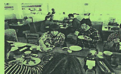
おいしそうに食べています。