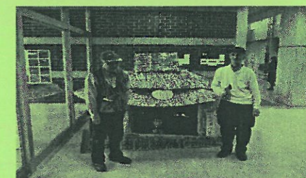
縄文館にはこんなものも…。