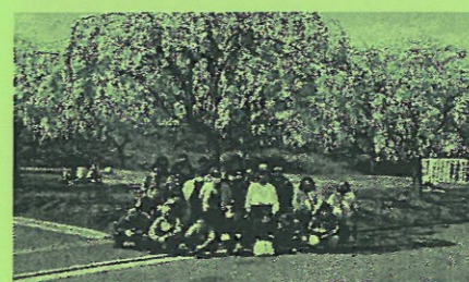
八戸公園の桜の前で1枚。